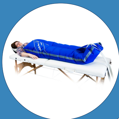
Lympha Pants PCD Easy (kalhoty 16 komor)