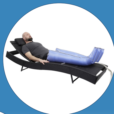
PCD Leg Sleeve návlek na nohu (4/8 komor)