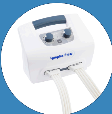
Lympha Press® PCD 51