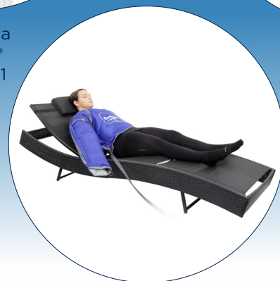
PCD Comfylite návlek na ruku s axilou a hrudníkem (8 komor)