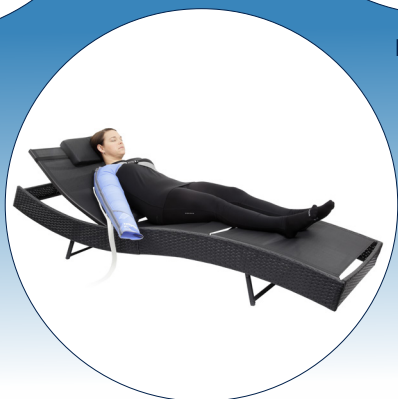
PCD Arm Sleeve návlek na ruku (4 komory)